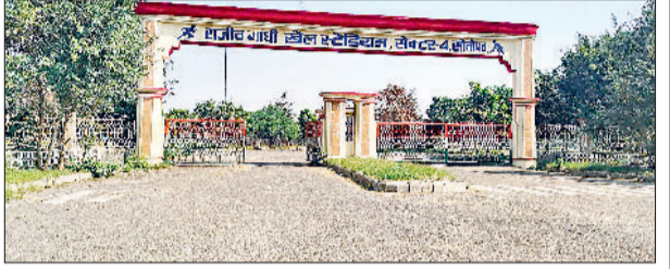
पार्कों में अभ्यास करने को मजबूर खिलाड़ी

रफ्तार की बजाए टो ब्रेकर ट्रैक के लिए बनाए गए ट्रैक का हाल भी बेहद खराब है। ट्रैक कई जगह से उखड़ चुका है और असमलत हो गया है। खिलाड़ियों को तेज रफ्तार में दौड़ते समय चोट लगने का खतरा बना रहता है। कई युवा खिलाड़ियों ने बताया कि खराब ट्रैक के कारण उनके पैरों में मोच आना आम बात हो गई है। मैदान में जगह-जगह झाड़ियां उग आई हैं, जो ट्रैक और अभ्यास दोनों के लिए बाधक बन रही हैं।