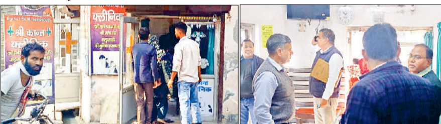
राई। क्लीनिक पर छापा मारकर जांच की और अवैध दवाइयों को कब्जे में ले लिया