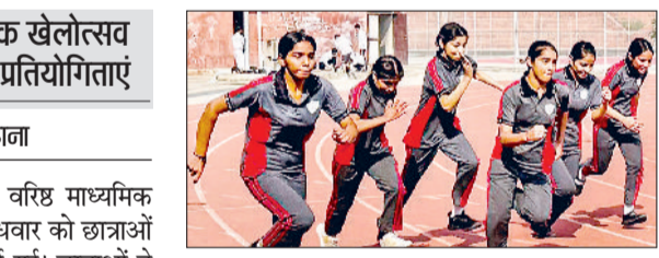
गोहाना। दौड़ प्रतियोगिता में एक दूसरे को पछाड़ने का प्रयास करते हुए छात्राएं।