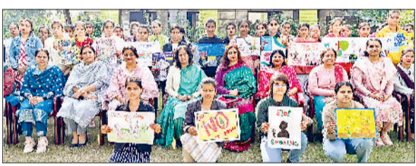
खरखौदा। नशा मुक्ति संबंधी पोस्टर दर्शाती छात्राएं