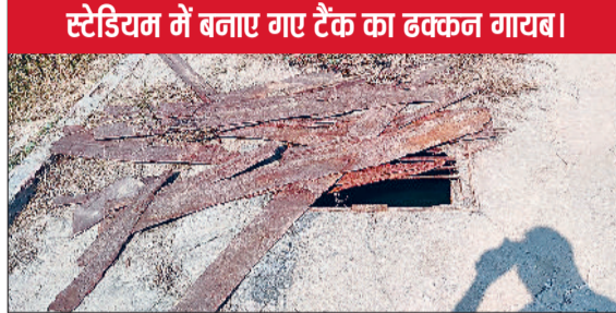
स्टेडियम में बनाए गए ट्रैक का ढक्कन गायब।

जर्जर इंफ्रास्ट्रक्चर यह हालत तब है, जब जिले में खेल प्रतिभाओं को आगे बढ़ाने के उद्देश्य से इन परिसरों का उपयोग हजारों खिलाड़ी रोजाना करते हैं। जर्जर इंफ्रास्ट्रक्चर, अव्यवस्था और प्रशासन की उदासीनता ने खिलाड़ियों के मन में निराशा और असुरक्षा दोनों पैदा कर दी है। सुभाष स्टेडियम की स्थिति चिंता का विषय बनी हुई है। स्टेडियम के मुख्य भवन को पहले ही कंडम घोषित किया जा चुका है। भवन की स्थिति इतनी खराब है कि खिलाड़ी उसके आसपास भी जाने से बचते हैं। दीवारें टूट चुकी हैं, छत गिरने का खतरा बना रहता है और कई जगह लोहे के सहारे तक उखड़ चुके हैं। बावजूद इसके मरम्मत का काम अभी तक शुरू नहीं हुआ है।