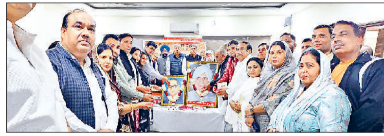
सोनीपत। कार्यक्रम के दौरान बाबा साहेब को नमन करते हुए कांग्रेसी।