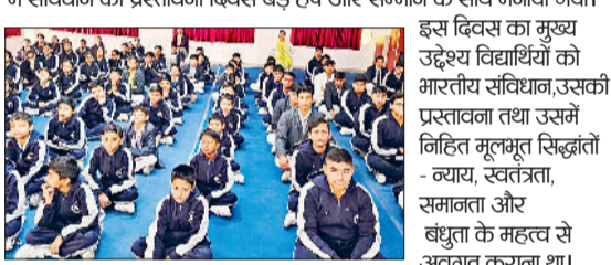
कार्यक्रम की शुरुआत प्रातःकालीन सभा में संविधान की प्रस्तावना के सामूहिक पाठ से हुई, जिसमें सभी छात्र-छात्राओं और शिक्षकों ने सक्रिय रूप से भाग लिया।

सोनीपत। सरस्वती शिक्षा संस्थान सीनियर सेकेंडरी स्कूल सोनीपत (एस-7) में संविधान की प्रस्तावना दिवस बड़े हर्ष और सम्मान के साथ मनाया गया। इस दिवस का मुख्य उद्देश्य विद्यार्थियों को भारतीय संविधान, उसकी प्रस्तावना तथा उसके निहित मूलभूत सिद्धांतों - न्याय, स्वतंत्रता, समानता और बंधुता के महत्व से अवगत कराना था। कार्यक्रम की शुरुआत प्रातःकालीन सभा में संविधान की प्रस्तावना के सामूहिक पाठ से हुई, जिसमें सभी छात्र-छात्राओं और शिक्षकों ने सक्रिय रूप से भाग लिया। इसके पश्चात सामाजिक विज्ञान विभाग द्वारा संविधान के इतिहास, निर्माण प्रक्रिया, संविधान सभा के कार्य तथा डॉ. भीमराव अंबेडकर के अमूल्य योगदान पर विस्तृत जानकारी प्रस्तुत की गई।