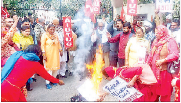
सोनीपत। लघु सचिवालय के सामने विरोध प्रदर्शन करते हुए।