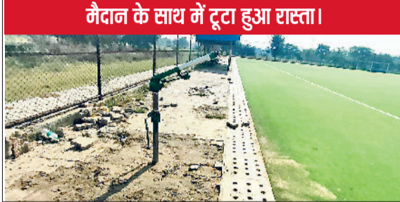
मैदान के साथ में टूटा हुआ रास्ता।

सुविधाओं की चोरे कमी और सुरक्षा मानकों की अनदेखी के चलते सैकड़ों खिलाड़ी हर दिन एक बड़े खतरे के साये में अभ्यास करने को मजबूर हैं। सुभाष स्टेडियम हो या सेक्टर-4 खेल स्टेडियम, दोनों ही मैदानों में