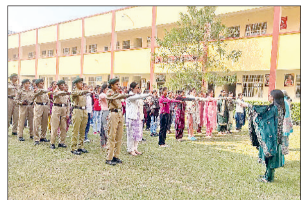
सोनीपत। टीकाराम महाविद्यालय में शपथ लेती छात्राएं।

सोनीपत। सोनीपत के टीकाराम महाविद्यालय में मंगलवार को राजनीतिक विज्ञान विभाग और कंप्यूटर विज्ञान विभाग द्वारा संविधान दिवस मनाया गया। कार्यक्रम की शुरुआत महाविद्यालय परिसर में प्राध्यापिकाओं और छात्राओं द्वारा संविधान के प्रति समर्पित रहने की शपथ ग्रहण से हुई। उपस्थित शिक्षकों ने छात्राओं को संविधान के महत्व, उसके मूल सिद्धांतों और नागरिक कर्तव्यों के बारे में जानकारी दी।